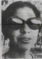
Lumi Videla, asesinada por la DINA en Ñuñoa

donde se llevará a cabo este encuentro teatral. Las cuatro primeras obras del Festival serán interpretadas por los actores de la citada compañía y la quinta, actuada por familiares de ejecutados políticos.