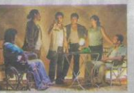
dentro de la sociedad, se enfrentarán a un desafío más grande: qué hacer con su impulso destructivo. (27 y 28 de enero, 21hrs)

Un grupo de jóvenes se reúne a urdir distintos fragmentos del atentado en contra del dictador Augusto Pinochet, perpetrado en el año 1986. A medida que se van acercando a su objetivo, los protagonistas van perdiendo el impulso y la vehemencia de su empresa. Embogados por sus palabras, van comprendiendo que su irreverencia sólo forma parte de un pasado que ya no les pertenece. Sin saber qué hacer y sin entender qué papel juegan