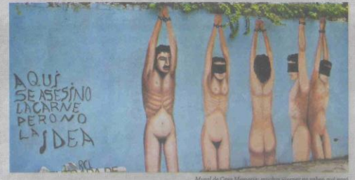
Mural de Casa Memoria: muchos jóvenes no saben qué pasó

"Creemos que hoy, más que nunca, el desafío es hacernos cargo por las futuras generaciones y por el país en el cual queremos vivir. Es por eso que nosotros, como Casa Memoria, todavía creemos y soñamos con un Chile donde la responsabilidad, el auténtico diálogo basado en la búsqueda de la verdad, el respeto de cada persona y su dignidad, y la unidad sean los motores de búsqueda de una sociedad para generar los escenarios más propicios, de cara a un verdadero desarrollo humano integral, a través de una educación más digna, de calidad y enfocada a los derechos humanos".